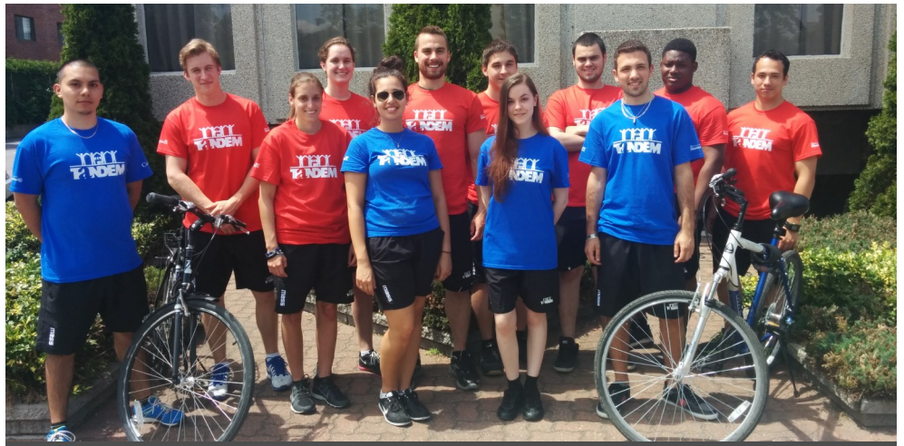
Voici la patrouille à vélo et la brigade graffiti de 2014

Saviez-vous que depuis 2008 Tandem s'affaire au repérage et au nettoyage de graffitis sur le domaine public et privé? Le service est offert gratuitement et est disponible à longueur d'année. N'hésitez pas à nous contacter en cas de vandalisme!