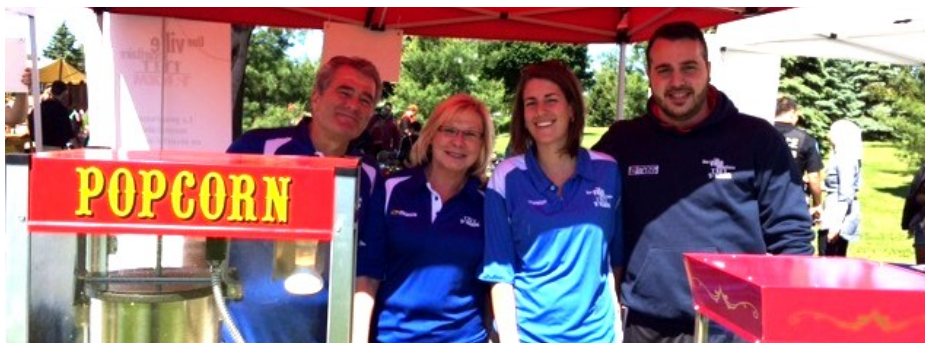
L'équipe Tandem à la fête de l'arrondissement le 6 juin!