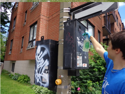
La brigade graffiti et la patrouille à vélo de 2014 en action!