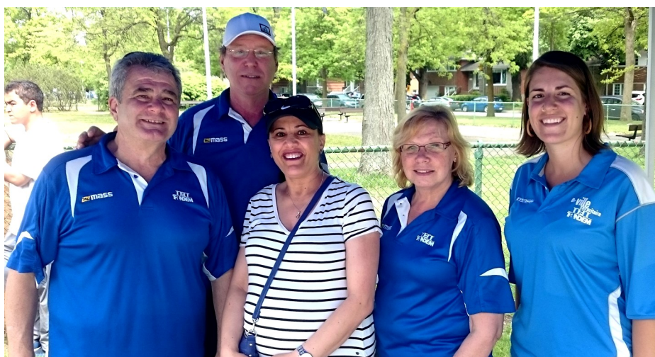
L'équipe Tandem à la fête de de la famille le 28 mai !