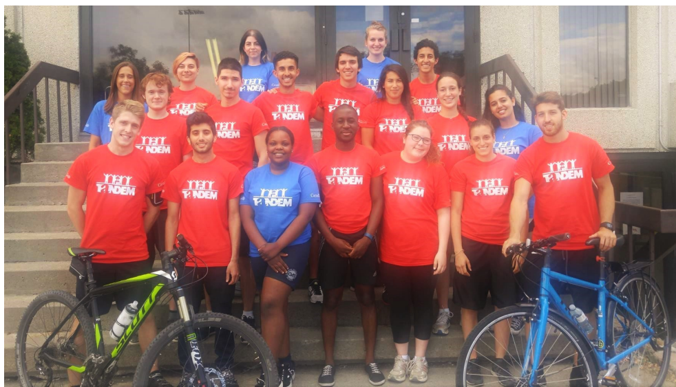
Voici la patrouille à vélo et la brigade graffiti de 2016