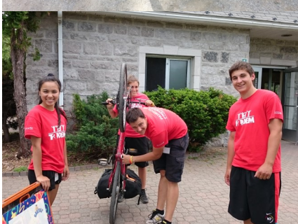
La brigade graffiti et la patrouille à vélo de 2015 en action!