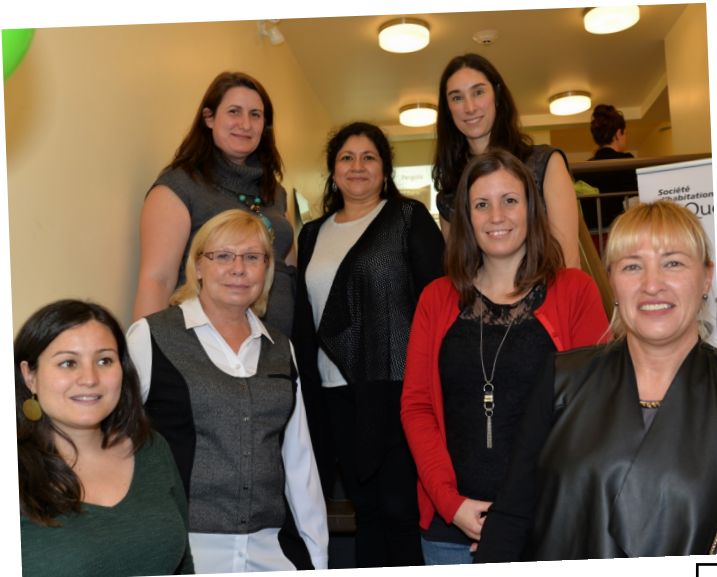
Grandir jusqu'au toit 2016