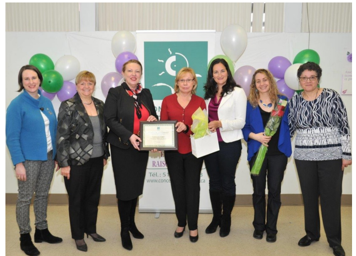
Concertation femme 2016

Mes collègues et mes amis me décrivent comme une personne travaillante, méticuleuse et réservée. Certains me considèrent parfois rigide, mais je l'assume. Je suis consciencieuse dans mon travail et je fais de mon mieux. J'aime que l'environnement au travail soit agréable pour toute l'équipe et je fais le nécessaire pour y arriver.