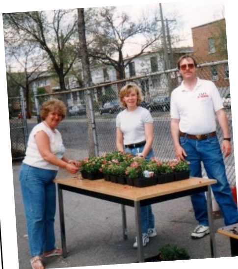
Projet fleur 1999

Je suis adjointe administrative. Mon mandat consiste à effectuer un ensemble d'activités de nature administrative qui découlent de l'exploitation de l'organisme. Je participe aussi à certains comités de travail avec les partenaires. Fait à noter qu'initialement j'occupais un poste de secrétaire animatrice. Mes tâches étaient partagées entre la comptabilité et l'animation. Par le biais d'un projet dans les écoles et les garderies de l'arrondissement, je sensibilisais les jeunes sur les conséquences du vandalisme fait sur les livres de la bibliothèque.