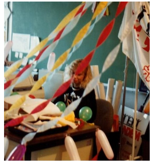
Bonne fête 1995