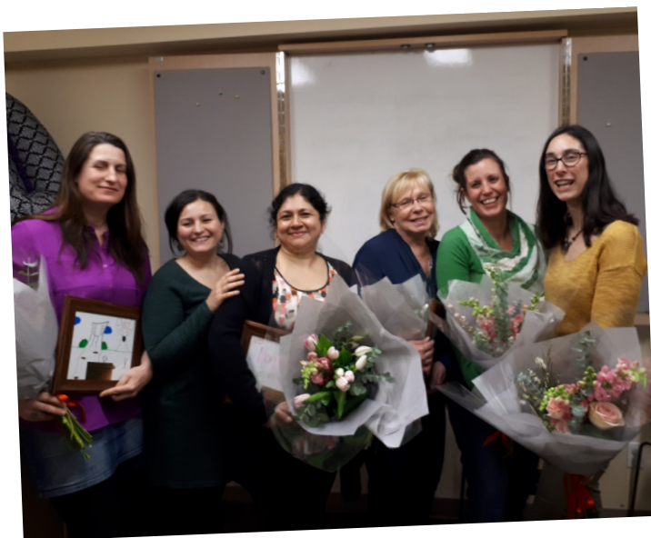
Mon toit, mon quartier 2018

Je leur dirais qu'ils vont vivre une expérience unique. Que le contact direct avec les citoyens, les intervenants, les élus, les membres d'un conseil d'administration, les agents sociocommunautaires, etc. se situent à une dimension plus humaine. Le service personnalisé du milieu communautaire ouvre une riche possibilité d'échanges. Pour évoluer dans cette sphère, il faut avoir du cœur, de l'écoute, il faut être passionné et fier de contribuer à aider la société. Finalement, travailler dans le milieu communautaire exige une grande autonomie. Ne passez pas à côté, si l'occasion se présente, le milieu communautaire donne des ailes.