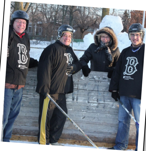
La Classique 2015

Un premier projet que j'ai adoré présenter a été le Docteur Du bouquin . Éduquer les jeunes enfants sur le vandalisme a été un défi pour moi. Les enfants font partie d'un public très vrai, sans filtre, ils aiment ou ils n'aiment pas. Par ailleurs, j'ai participé à la vidéo sur la sécurité lors des déplacements en transport en commun, projet en collaboration avec la STM. Avec mes collègues, j'ai pris part à plusieurs projets, entre autres, le projet Fleur, le labyrinthe hanté et les mardis sur la piste cyclable. Je suis aussi très fière d'avoir contribué à la mise en œuvre de Grandir jusqu'au toit , premier projet de l'organisme d'habitation Mon Toit, Mon Cartier et de ma participation sur le comité de la violence intrafamiliale (comité issu de la planification stratégique du CLIC 2013-2017). Sans oublier la création du projet Sous-verres avec le Comité femme du Regroupement des organismes mandataires du programme Tandem.