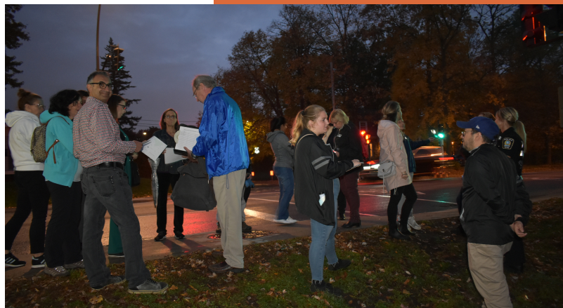
Photo prise au début de marche à 18h30